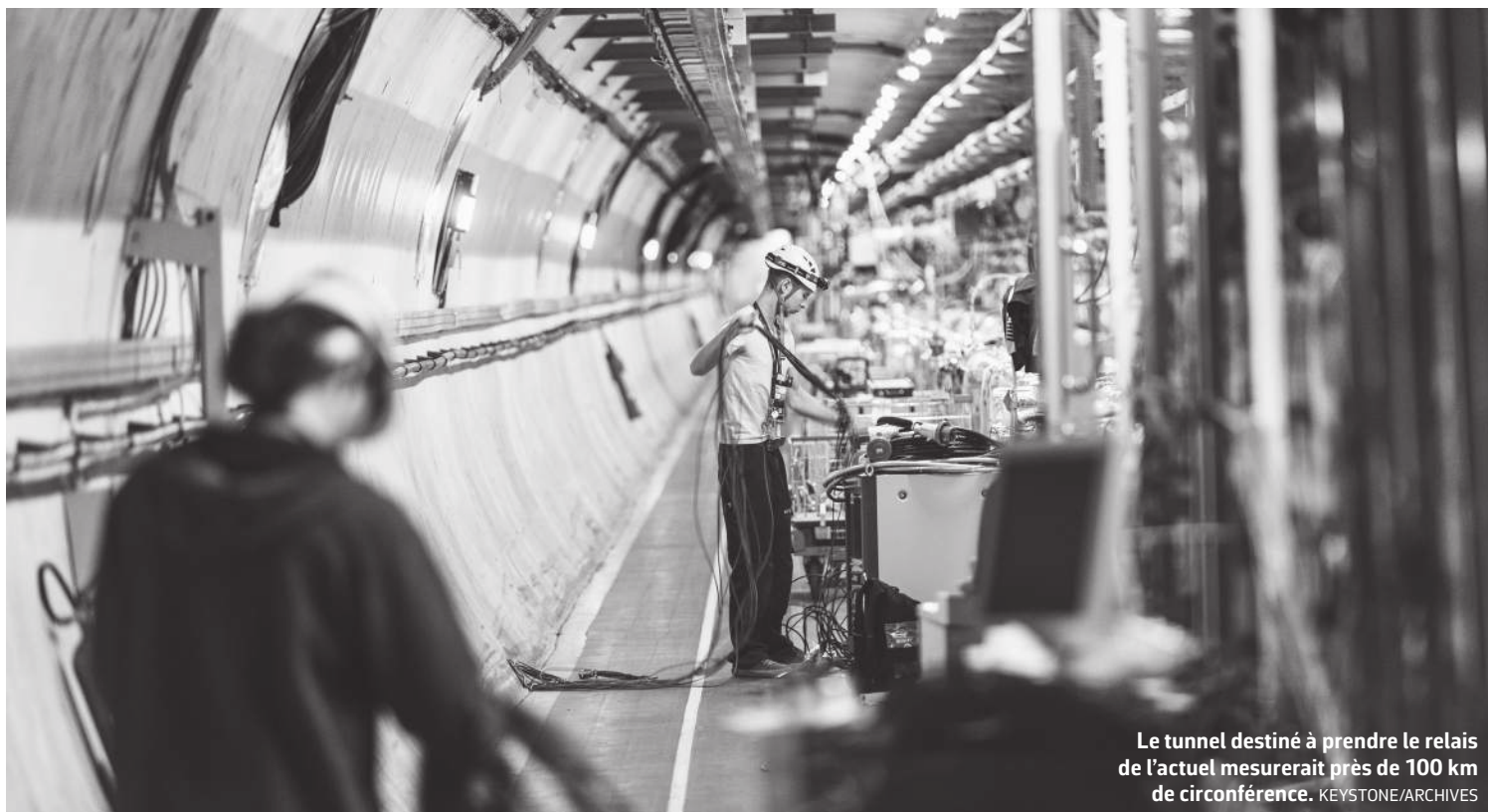
Le tunnel destiné à prendre le relais de l'actuel mesurerait près de 100 km de circonférence.

5 La consommation énergétique du futur collisionneur que le CERN ambitionne de construire inquiète. Selon une ONG genevoise, cette construction pharaonique anéantirait les efforts entrepris pour réduire la facture suisse d'électricité.